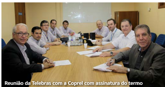
Reunião da Telebras com a Coprel com assinatura do termo