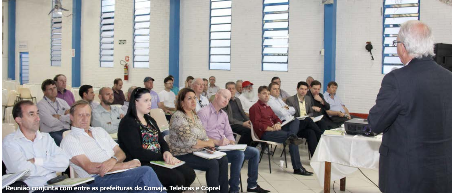
Reunião conjunta com entre as prefeituras do Comaja, Telebras e Coprel