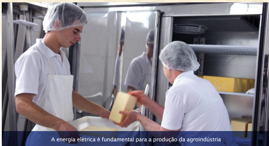
A energia elétrica é fundamental para a produção da agroindústria

A COPREL Geração e Desenvolvimento vai auxiliar os cooperantes que precisam de segurança na continuidade do fornecimento de energia elétrica para situações atípicas, como em temporais.